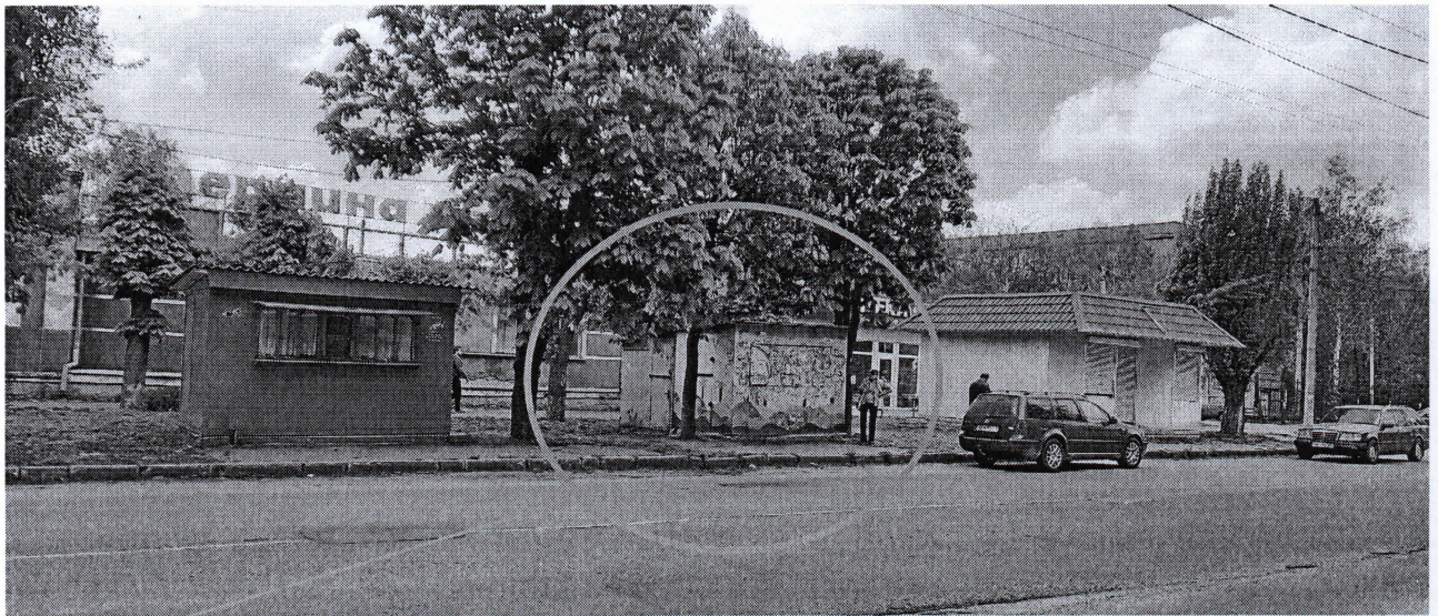
Фотознімок тимчасової споруди по вул. Полтавській в місті Могилеві-Подільському, що підлягає демонтажу.