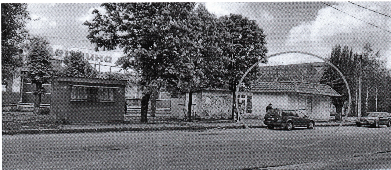
Фотознімок тимчасової споруди по вул. Полтавській в місті Могилеві-Подільському, що підлягає демонтажу.