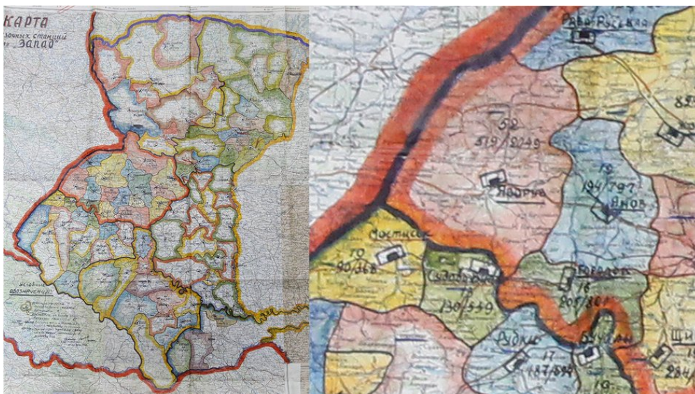
Карта вантажних станцій у справі "Операція "Захід"

Він додав, що усе відбувалося "цілком таємно" і за всіма правилами військової операції.